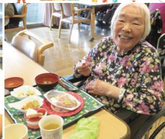
【12月 忘年クリスマス会】 クリスマスランチとサンタの帽子で雰囲気 づくり