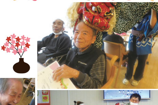
獅子舞と福笑いで正月祝い