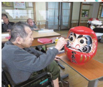
【年末年始】 大晦日と元日の達磨の目入れ