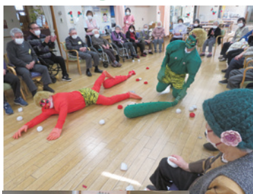
【2・3月】 節分とひな祭り